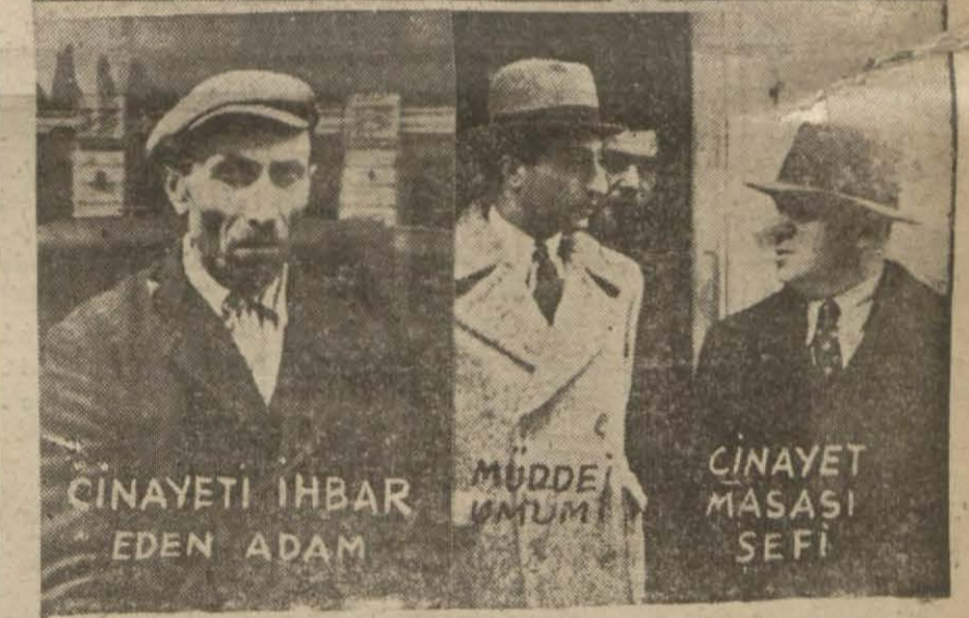
“Son Posta” foto muhabiri dün hâlise mahallinde bunları gördü. 30 ilkeşrin gecesi Beyoğlunda Is - cinayet işlendiğini, iki hemşerisi tara- fından tuzağa düşürülen Kığılı bir mek- bodrum katında tüyler ürpertici bir (Devamı 5 inci sayfada)