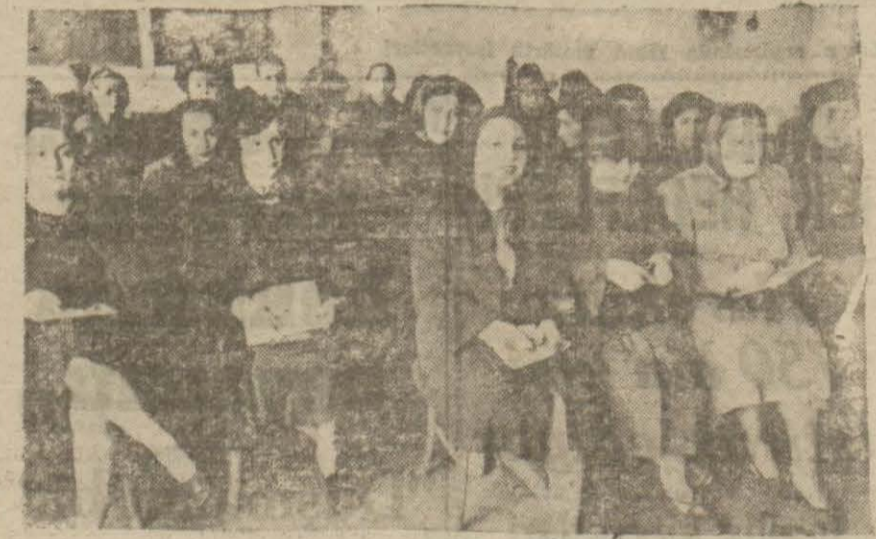
Kursa iştirak edenler

Alatınca ses ve saz san'atkarları için dün öğleden sonra Esnaf Cemiyetleri binasında bir kurs açılmıştır.