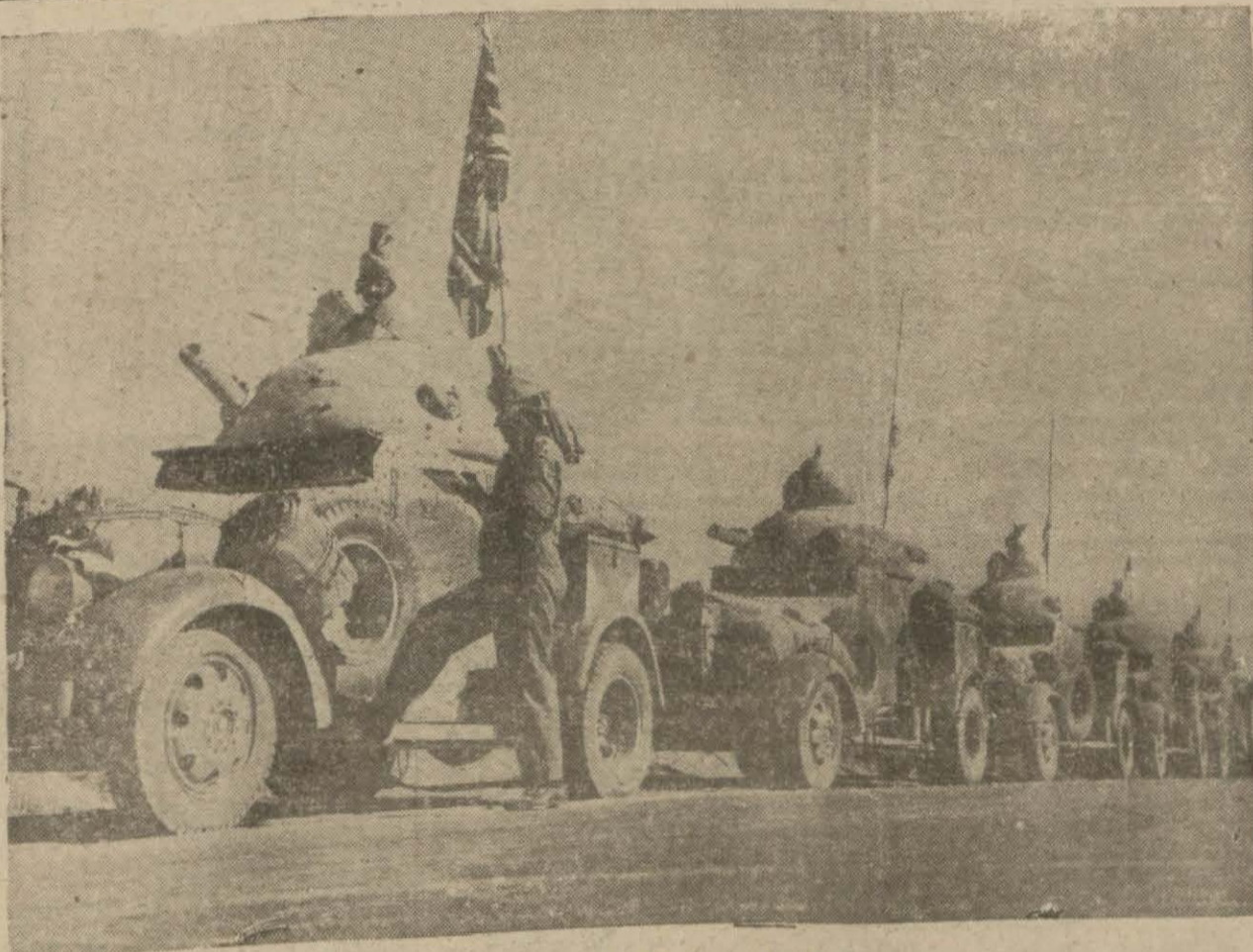
Libya cephesinde Elnd motörlü kuvvetleri

Ankara, 20 (T.E.) — İntihab ka- nununda bazı tadilat yapılması mevzu bahis. Mebus seçiminde tek dereceli intihab usulünün kabulü imkân- ı için mebus seçiminde, müntehibi sa- niye lüzum kalmayacak, halk vekil- lerini doğrudan doğruya seçecektir. Hazırlanan İlayha yakında Meclise tevki edilecektir.